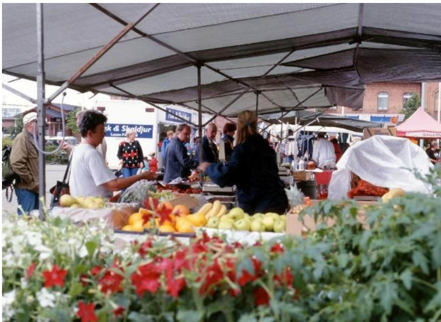
Figur 6. Marknadsförsäljning, (Arvika kommun).

Tillfällig upplåtelse på torget -på dagar som inte är torgdag, behöver tillstånd från polisen.