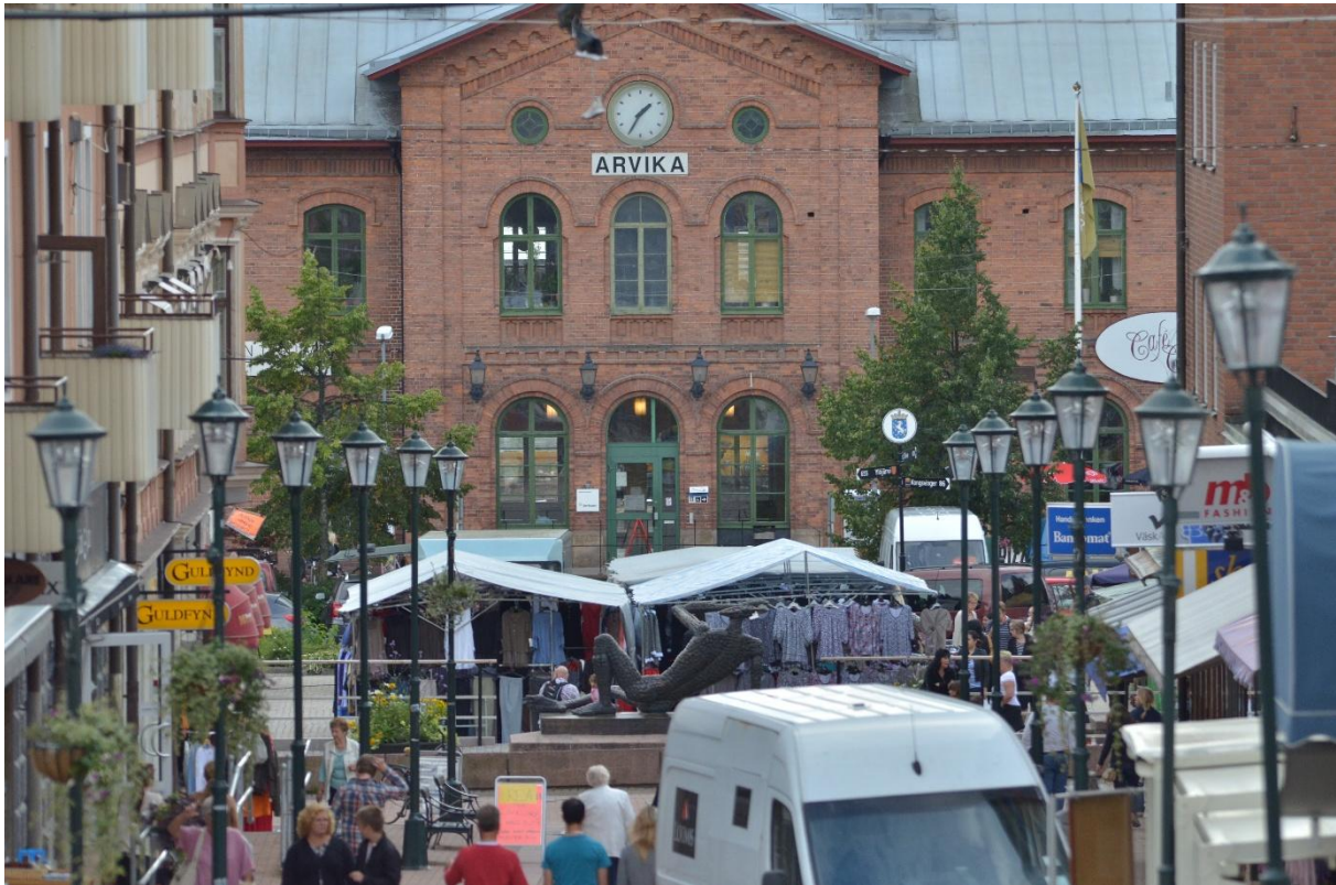
Figur 2. Torgdag

Upplåtelse av offentlig plats innebär att få tillstånd att använda platsen för ett visst ändamål som den normalt inte är avsedd för. Tillstånd krävs för all form av uppställning. Det kan gälla allt från trottoarpratere och skyltvaror utanför butiker och lokaler, till iordningställande av uteservering. Även offentliga tillställningar och allmänna sammankomster som marknad, stadsfest eller demonstrationer behöver ansöka om upplåtelse av offentlig plats.