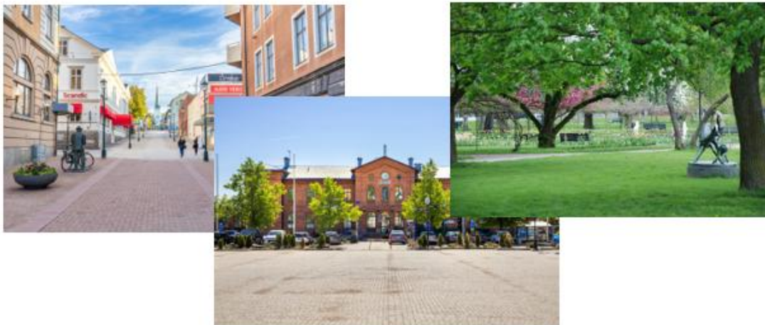
Figur 1. Offentliga platser, (Arvika kommun).