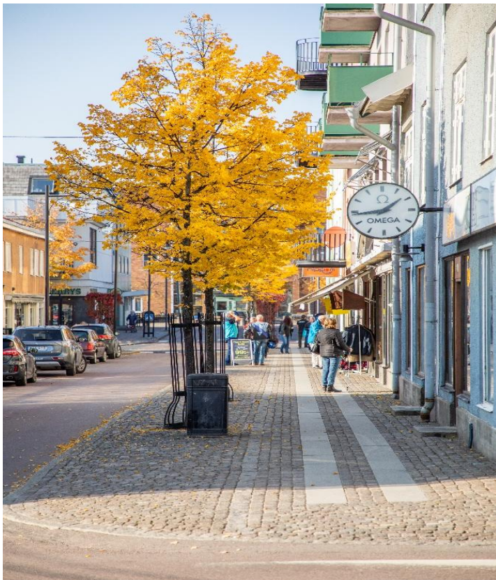
Figur 4. Fasadliv, gångbana med hällar och möbleringsyta, (Arvika kommun).