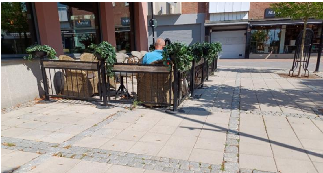
Figur 7. Uteservering, (Arvika kommun).

Tillståndstiden för uteserveringar är mellan 1 april – 30 september . Möjlighet finns att söka förlängt tillstånd 1 april – 15 oktober, med förutsättning att uteserveringen ska hållas öppen under marknadshelgen, första helgen i oktober. Vid förlängt tillstånd har marknadsarrangören rätt att ta ut avgift för marknadsplatserna som uteserveringen tar i anspråk.