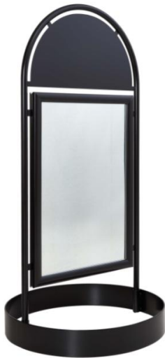
Figur 5. Trottoarpratere, City Sign.

Om trottoarpratere önskas bör rekommenderad modell "City Sign" användas som är en stabil, svartlackerad konstruktion med tydlig sarg i nederkant som gör den lätt att upptäcka (se bild nedan).