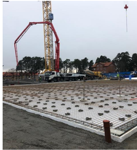
Armerat och klart för gjutning