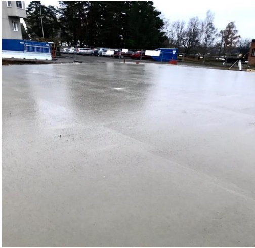
Plattan Hus 4