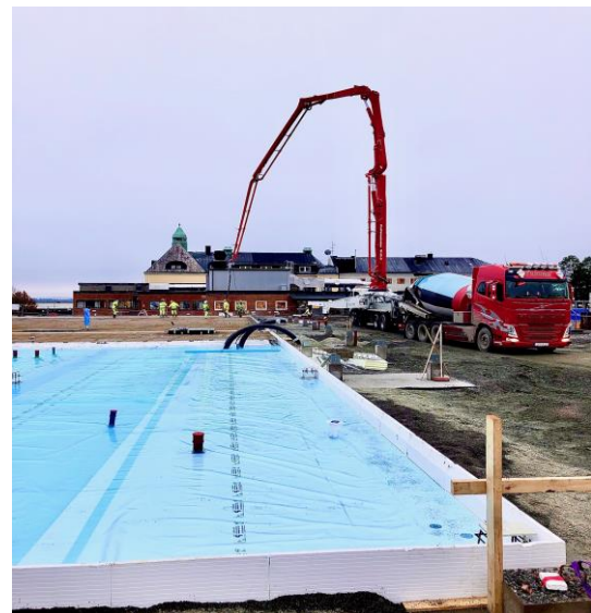
Pumpbilen ställer uppsig för gjutning i Hus 4

Platsledning, Mark, Betong, Rör, El, Kranförare.