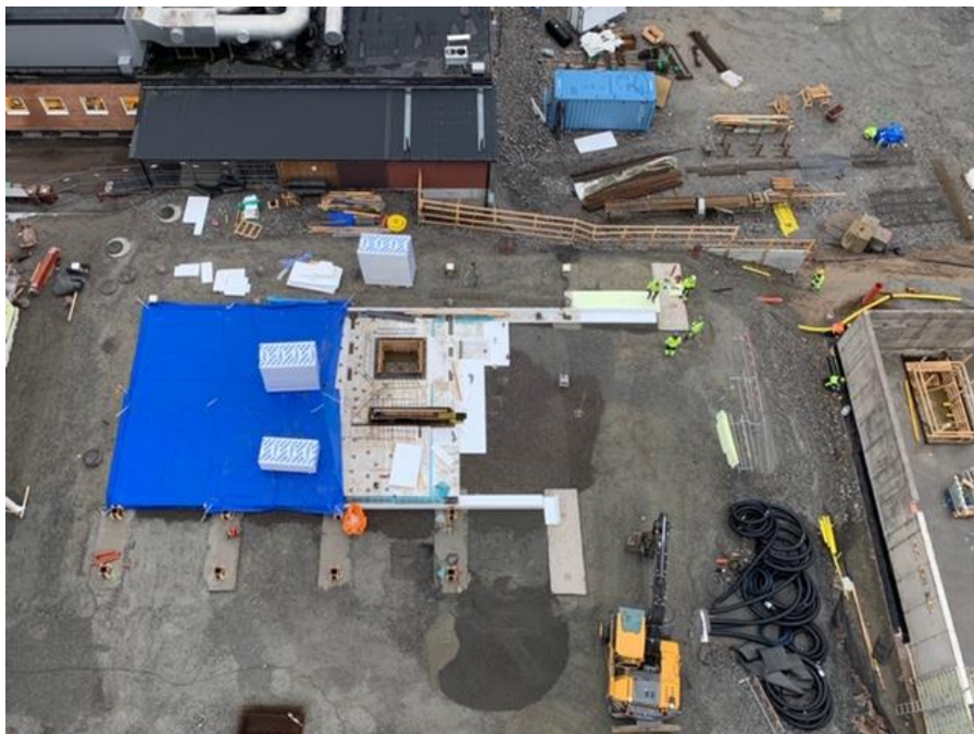
Hus 1 förbereds för gjutning av bottenplattan.