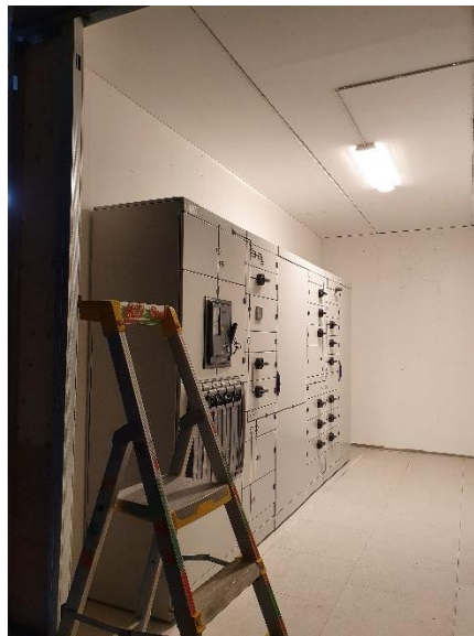
Ställverk i källaren Hus 2