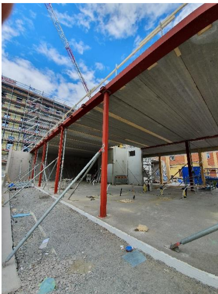
Matsalen börjar ta form